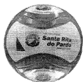
MODELO BOLA FUTEBOL

Bola de futebol de campo confeccionada em PVC pesando entre 410 e 440 gramas, circunferência entre 66-69 cm, com calibragem entre 6-9 libras, miolo substituível e lubrificado, camara airvillity, construção tecnofusion, produzida em 6 gomos. O item deverá ser personalizado com a logo do município e as cores propostas pela administração de acordo com a arte anexa a este documento. Os itens deverão seguir fielmente a palheta de cores e a padronização dos mesmos. Conforme layout.