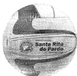
MODELO BOLA VOLEI

Ora, a própria vencedora do certame, a empresa ALLAN MOVEIS E BRINQUEDOS EDUCATIVOS LTDA, CNPJ: 50.850.224/0001-60, apresentou manifestação através do email institucional do setor de licitações do município, reconhecendo que o produto que fora ofertado no certame de fato não atende às especificações do edital, tanto que requereu a desclassificação de sua proposta, renunciando expressamente à sua proposta e requerendo a sua exclusão do certame.